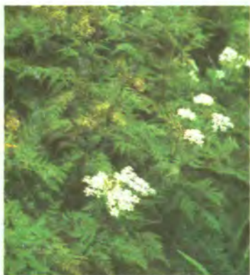
709. Мірис запашний.